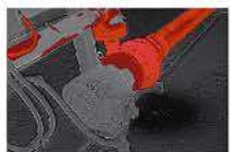
閾値設定機能 カラーアラーム機能