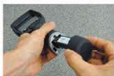
リプレーサブルバッテリー