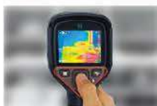
片手で全ての操作が可能