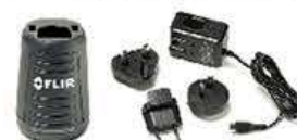
充電器(ACアダプタ付) ¥30,000