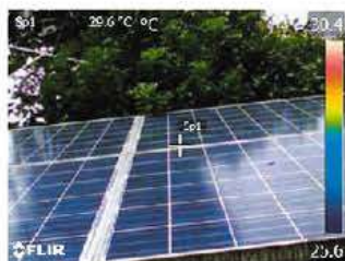
デジタルカメラモード

MSX®機能(スーパーファインコントラスト機能)は、リアルタイムで画像を補正することができ、構造物の詳細や発熱箇所の判別が熱画像上で容易に行えます。また、デジタルカメラモードとの同時撮影も可能で、同画角の可視画像を簡単に生成することができます。