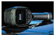
国内フルメンテナンス