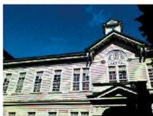
デジタルカメラモード

MSX ® 機能(スーパーファインコントラスト機能)は、リアルタイムで画像を補正することができ、構造物の詳細や発熱箇所の判別が熱画像上で容易に行えます。また、デジタルカメラモードとの同時撮影も可能で、同画角の可視画像を簡単に生成することができます。