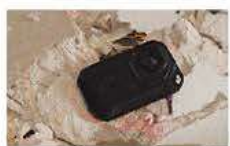
対落下衝撃性能: 2m (FLIR C3)