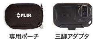
専用ポーチ 三脚アダプタ