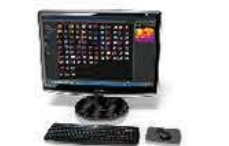
動画解析 (FLIR Tools使用時)