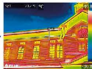
MSX ® モード