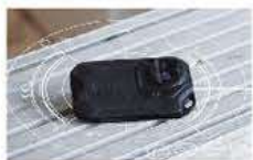
国内フルメンテナンス