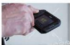
タッチスクリーン対応