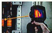
距離測定(レーザーオートフォーカス)