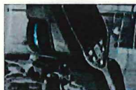
動画・タイムラプス撮影