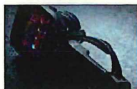
国内フルメンテナンス