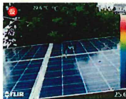
デジタルカメラモード

MSX ® 機能(スーパーファインコントラスト機能)は、リアルタイムで画像を補正することができ、構造物の詳細や発熱箇所の判別が熱画像上で容易に行えます。また、デジタルカメラモードとの同時撮影も可能で、同画角の可視画像を簡単に生成することができます。