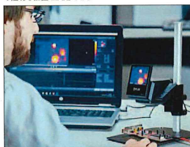
USBでコンピューターに接続し、FLIR Tools+でデータを分析